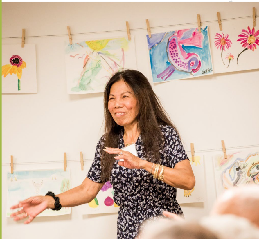
Movimiento y movilidad.

Mantenerse activo ayuda a las personas con enfermedad de Alzheimer y demencias relacionadas a sentirse mejor. El ejercicio ayuda a mantener los músculos, las articulaciones y el corazón en buen estado. Pueden hacer ejercicio juntos para que sea más divertido y disfrutable.