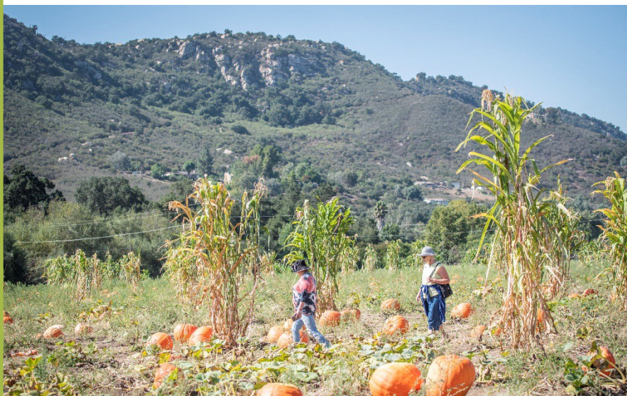
Fotografía de Alzheimer's San Diego: Salida para establecer conexiones.

La participación social es un componente clave para mantener una buena calidad de vida. Las personas en las etapas iniciales de la enfermedad de Alzheimer o demencia relacionada podrían disfrutar salir a lugares que disfrutaban en el pasado, como su parque favorito, un restaurante, un museo o visitas de familias y amigos.